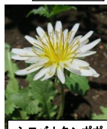
シロバナタンポポ