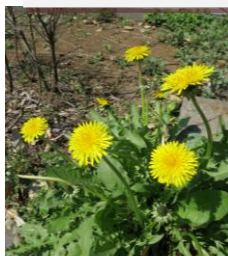
セイヨウタンポポ